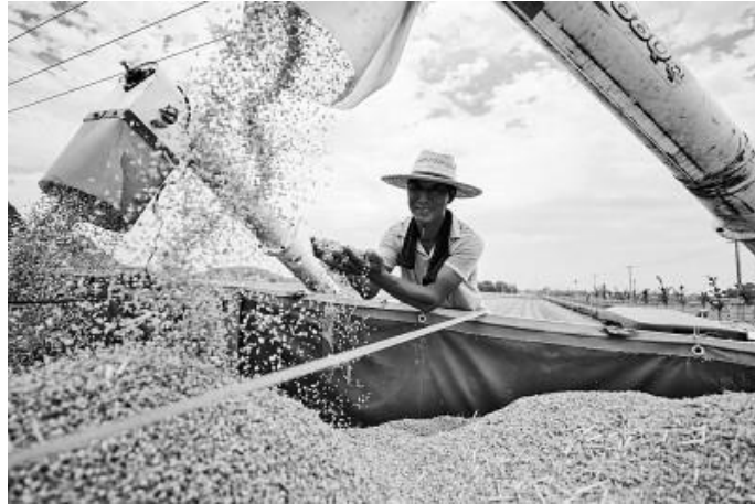
浙江湖州德清县洛舍镇农民在田间喜收小麦。

民为国基，谷为民命，粮食安全是国家安全的重要基础。袁隆平院士溘然长逝，留下的两个梦想全都关于粮食；举国上下对这位老人的由衷敬爱，正源于他为“中国粮食，中国饭碗”付出的无尽心血。如何继承袁老遗志，研究粮食、增产粮食、爱惜粮食，把对逝者的深切怀念转化为守护粮食安全的强烈意识与自觉行动？让我们走近农业科技工作者、基层干部、普通农民、高校师生，从粮食安全角度回顾袁老贡献之巨、探析当前任务之重，激励各界以实际行动接续奋斗，共圆袁隆平院士关于种子和粮食的梦想。